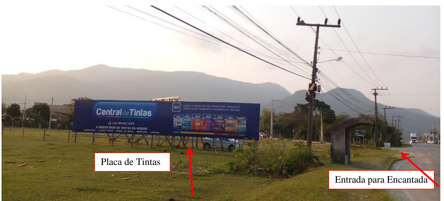
Placa de Tintas