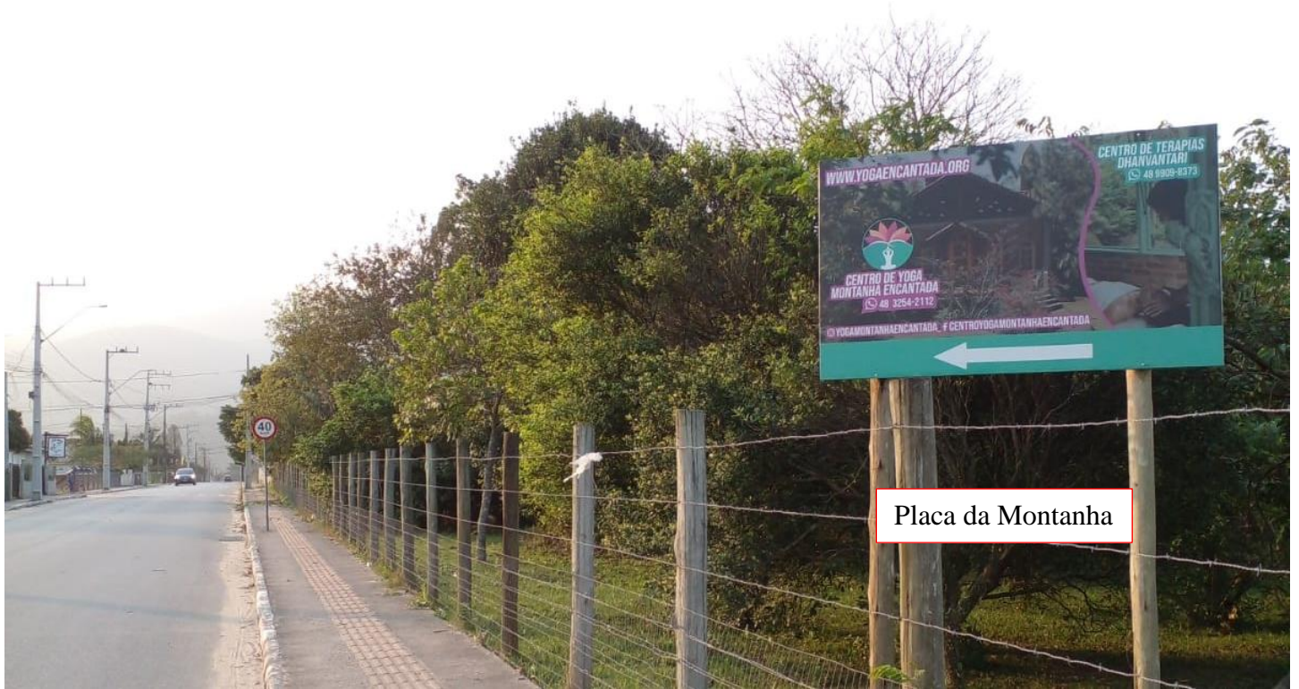
Placa da Montanha